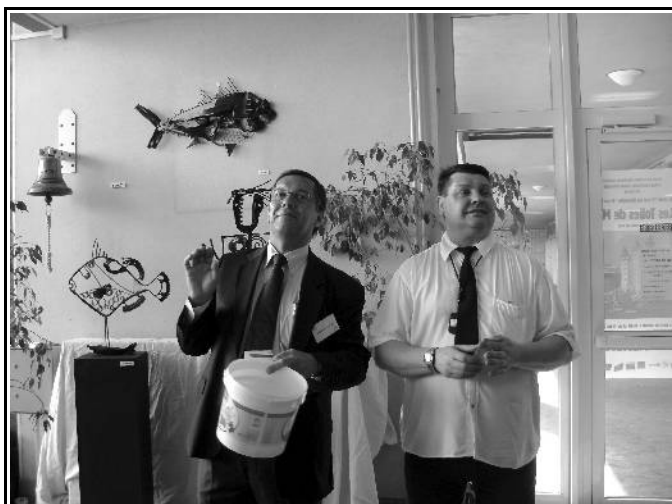
L'heureux gagnant en compagnie de Ch. Lachèvre

Les élèves de l'ENMM ont également participé et nous ont fait partager leur univers maritime ainsi que les élèves de l'école primaire Antoine Lagarde de Sainte Adresse. Nous félicitons et remercions les jeunes élèves du CM1 de Mme Girondel.