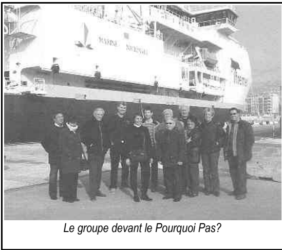
Le groupe devant le Pourquoi Pas?

Passerelle : Elle est de type panoramique, disposant bien sûr de tous les équipements modernes de navigation (DGPS, cartes électroniques, DP2....) Une maquette permet de mieux saisir la disposition du navire, avec la particularité d'une « casquette » située sous le navire où sont regroupés les différents capteurs scientifiques (Gravimètre, Courantomètres Doppler....)